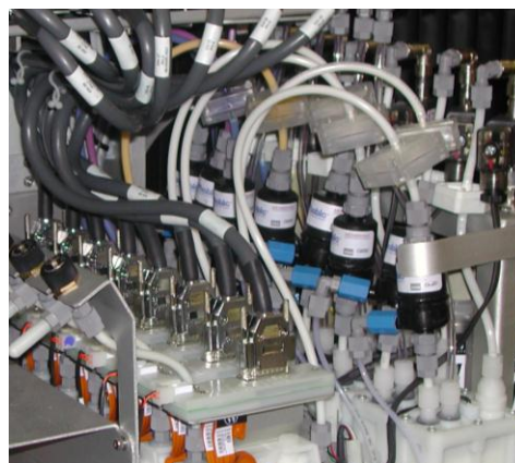
1 x 3スーパーフォビック分離膜コンタクター (脱気モジュール) / ワイドフォーマット・インクジェット・プリンター (印刷機)搭載

インクの充填工程でも、スーパーフォビック®分離膜 (脱気膜)は、ボトリングの直前で脱気・脱泡されパッケージング工程で使用されています。ボトリングにおける泡立ちはパッケージング工程を遅延させます。インク内におけるバブルは、印刷における品質低下を招きます。